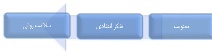
شکل ۱. مدل مفهومی فرضی پژوهش

در پایان براساس مطالبی که در مورد باورهای معنوی و تفکر انتقادی و رابطه هر دو با سلامت روانی بیان شد، این پرسش به ذهن می‌آید که آیا رابطه‌ای در بین هر سه مورد می‌تواند وجود داشته باشد؛ بدین معنا که آیا تفکر انتقادی در رابطه بین معنویت و سلامت روانی می‌تواند نقش واسطه‌ای ایفا کند؟