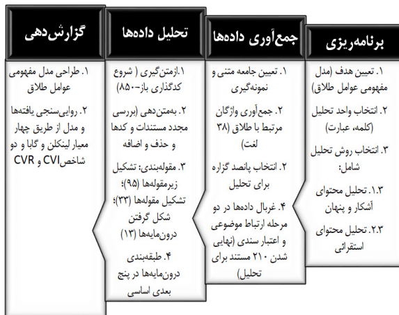
نمودار ۱. روند اجرای پژوهش برای طراحی مدل مفهومی عوامل طلاق در قرآن

برای اطمینان از اتکاپذیری داده‌ها و کمی‌سازی مطابق نظر شولتز، ویتنی و زیکار ۱ (۲۰۱۴) از ضریب شاخص روایی محتوا ۲ (CVI) و نسبت روایی محتوا ۳ (CVR) استفاده شد. روند اجرای پژوهش در نمودار ۱ قابل مشاهده است.